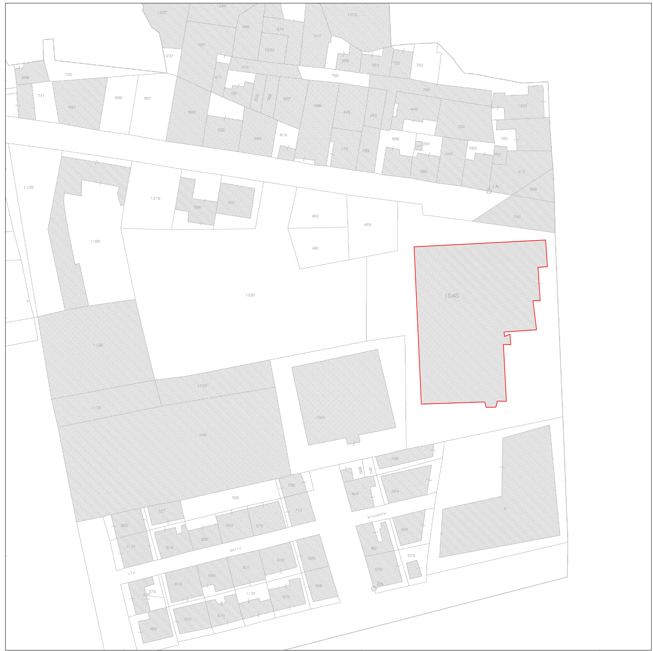
STRALCIO CATASTALE FOGLIO DI MAPPA N°200 PARTICELLA N°1045

SCALA 1:2.000 0 m 20 m 40 m 60 m 80 m 100 m 150 m