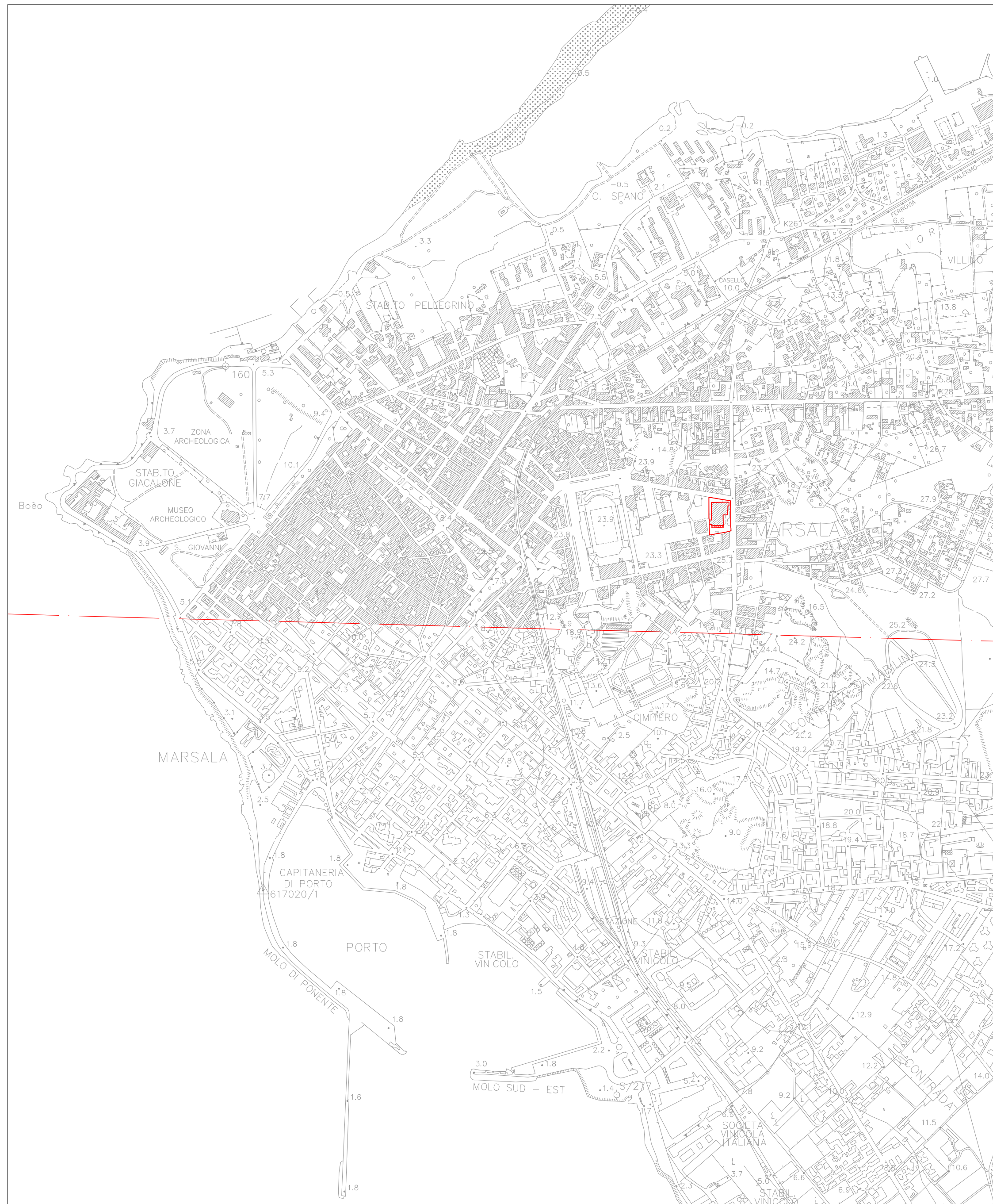
STRALCIO CTR FOGLIO N° 605140 - N° 617020

SCALA 1:25.000 0 m 250 500 m 1000 m 1500 m 2000 m