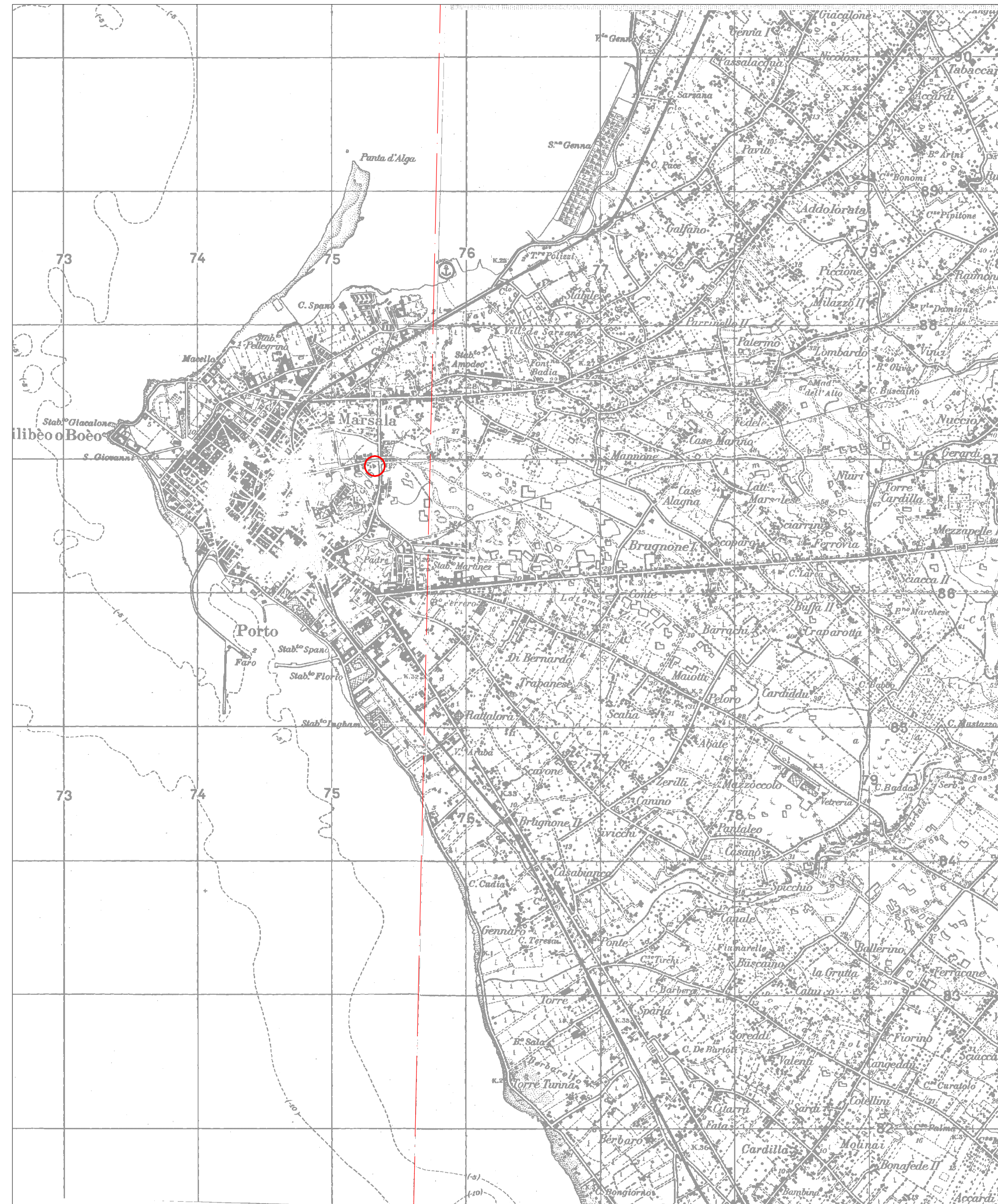
STRALCIO I.G.M. FOGLIO N° 256 II NE - MARSALA - N° 257 III NO - PAOLINI -

SCALA 1:25.000 0 m 250 500 m 1000 m 1500 m 2000 m